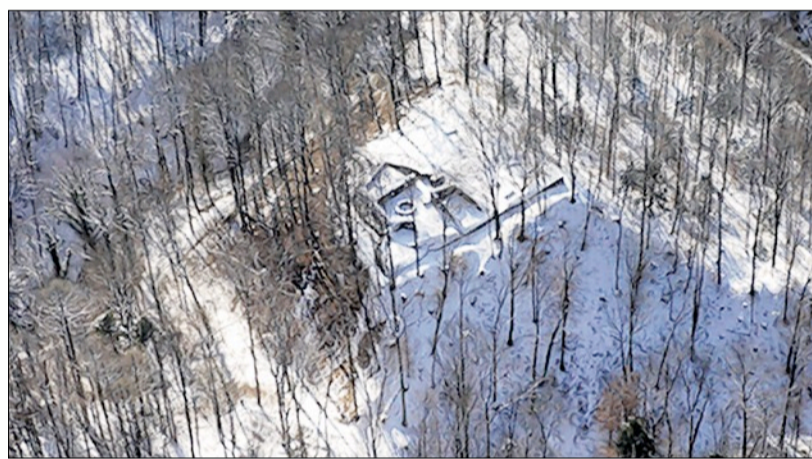
Luftbild der Burgruine Wulp, wie sie sich heute präsentiert.

mit klar definierten baulichen Grenzen. Auch die natürliche Umgebung hat sich stark gewandelt. Manch grosses ehemaliges Ried ist heute trockengelegt oder nur noch in kleinen Restflächen vorhanden. Limmat, Thur und viele Bäche fließen jetzt in einem kanalisierten Bett. Wegbereiter vieler Veränderungen waren die in der zweiten Hälfte des 19. Jahrhunderts angelegten Eisenbahnlinien und Kantonsstrassen.